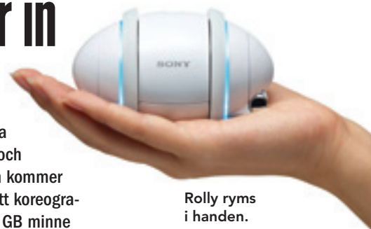
Rolly ryms i handen.

Har du ingen att dansa med kan du skaffa en Sony Rolly – som både spelar och dansar. Kul grej – frågan är bara hur länge man tycker det.