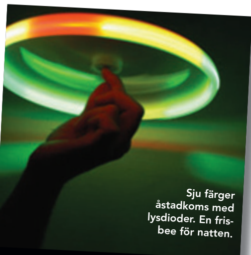
Sju färger åstadkoms med lysdioder. En fris- bee för natten.