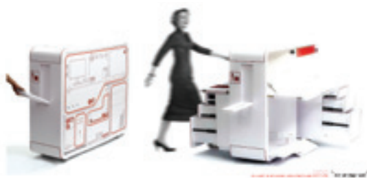
Arbetsplatsen kan vikas ihop till en kompakt låda.